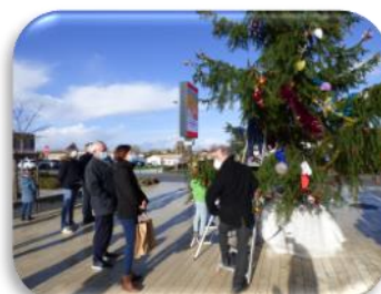
Décoration du sapin

La bibliothèque , nouvellement déplacée dans notre cœur de bourg fait aussi partie des moments forts de la vie de notre commune. Les visiteurs ne s'y trompent pas en adhérant en masse (plus de 300 adhérents), mais aussi au niveau des bénévoles qui se sont manifestés pour participer aux ouvertures et animations organisées.