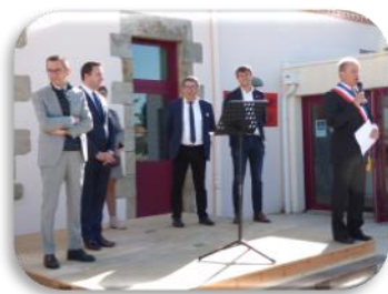
Inauguration du bourg

Néanmoins, nous avons pu inaugurer le centre-bourg avec Monsieur Bruno Retailleau en particulier, sénateur de la Vendée. La décoration du sapin de Noël, installé pour la première fois sur le nouveau parvis de la mairie, fut également un agréable moment à vivre pour de nombreux enfants accompagnés de leurs parents ou grands-parents. Cet évènement qui a beaucoup plu, ne demande qu'à évoluer pour en faire un moment convivial plus important.