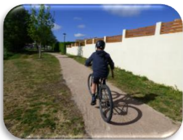
Nouvelle voie rue du Lieutenant Tougeron

Les travaux d'enrobés des routes et chemins (6 150 m 2 ), les arasages et curages des fossés (1 327 mètres linéaires) seront poursuivis cette année avec le même budget qu'en 2021.