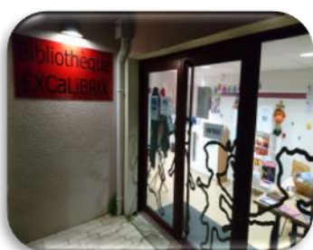
Entrée de la bibliothèque

La bibliothèque , nouvellement déplacée dans notre cœur de bourg fait aussi partie des moments forts de la vie de notre commune. Les visiteurs ne s'y trompent pas en adhérant en masse (plus de 300 adhérents), mais aussi au niveau des bénévoles qui se sont manifestés pour participer aux ouvertures et animations organisées.