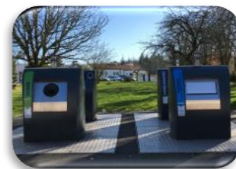
PAV rue des Ecoles

« Si on n'y arrive pas, on fera des déchets sauvages »